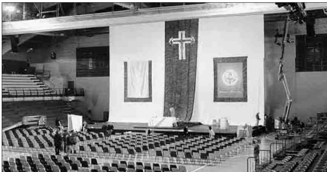
FINALMENTE. Il Palasport di Novara, ieri ancora vuoto: oggi ospiterà ottomila fedeli in festa per il beato rosminiano

Ai lati dell'altare sono state collocate le sedie per i vescovi e i sacerdoti che concelebreranno e per i religiosi e le religiose rosminiane (oltre 400 persone). A fianco la corale, composta da 200 cantori (il coro del Duomo di Novara, quello per le celebrazioni vescovili, quelli della zona dell'Ossola e i piccoli coristi del gruppo Santa Maria).